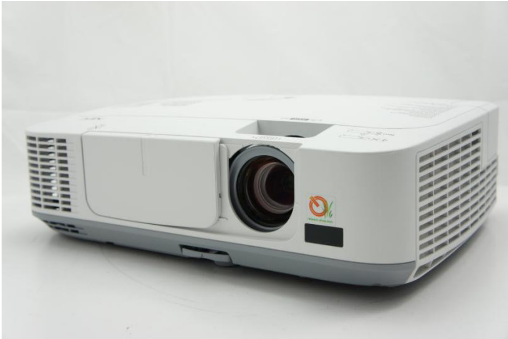
Refurbished NEC M300W von rebeam